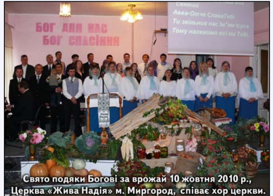
Свято подяки Богові за врожай 10 жовтня 2010 р., Церква «Жива Надія» м. Миргород, співає хор церкви.